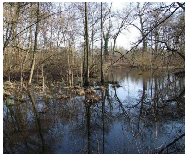
Réserve biologique de la Confluence Ill-Rhin