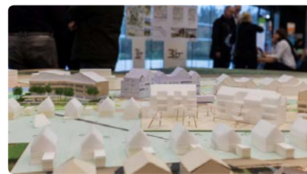
Salon de l'Habitat